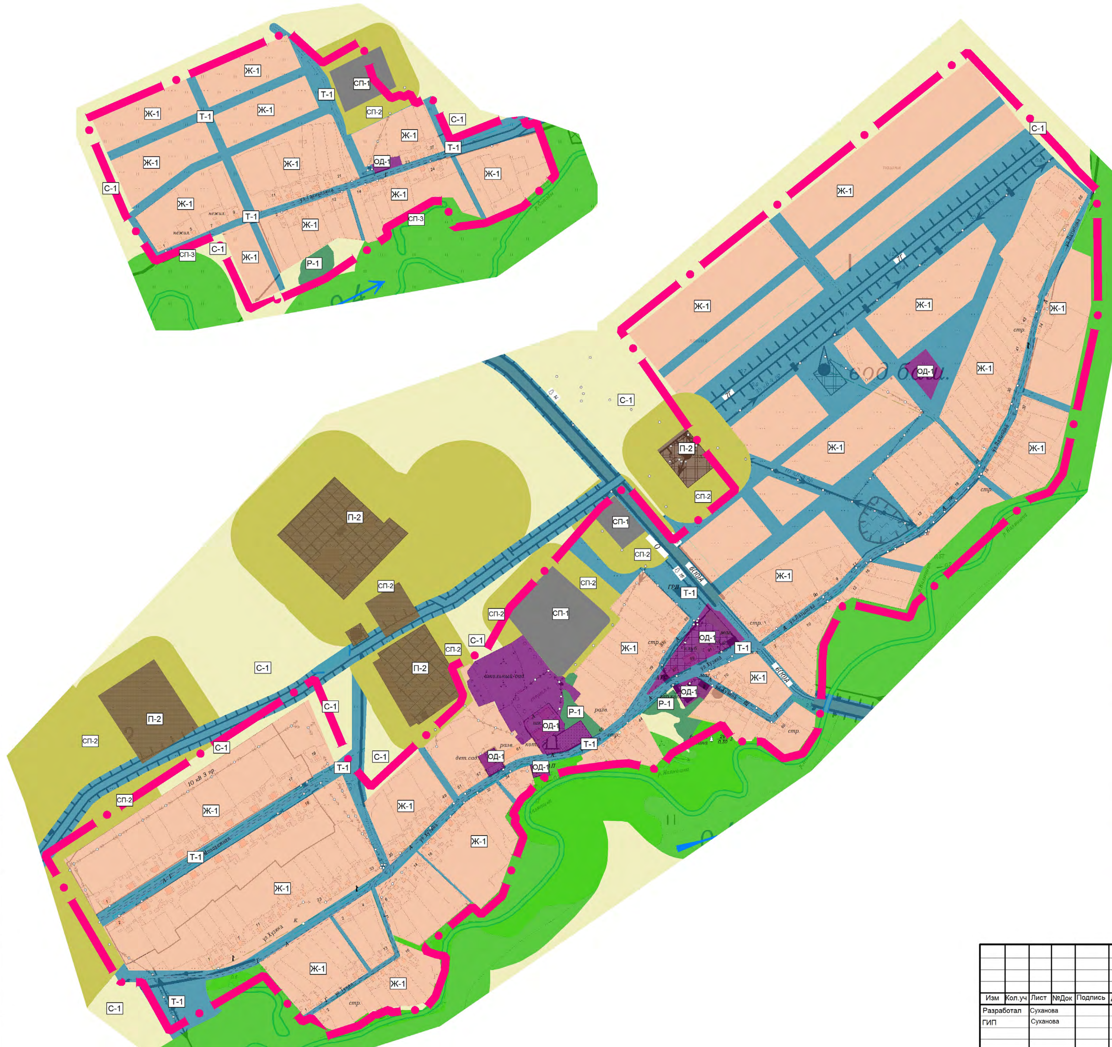
Карта градостроительного зонирования